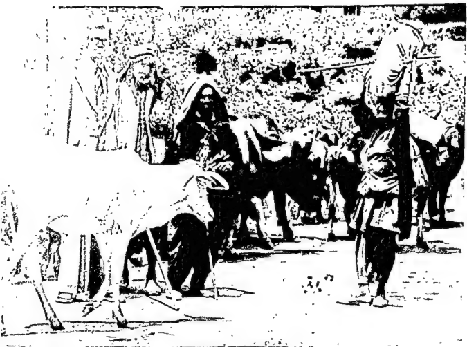
लेखक, यायावर गुज्जर परिवार के साथ